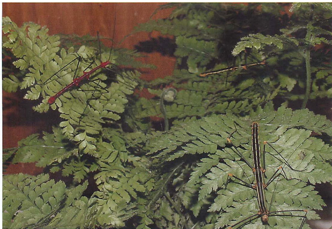
Rode varentakken, mannetje en vrouwtjes.