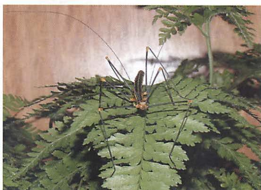
Rode Varentak vrouw.

die heel erg stinkt. Die komt tussen het hoofd en de hals tevoorschijn. De witte vloeistof is een mengsel van water en quinoline, dat is een vluchtige stof, verwant aan het bekende naftaleen. Mieren, spinnen, kikkers en kakkerlakken maken zich uit de voeten als ze deze stof ruiken, zo is bewezen in een Amerikaans laboratorium.